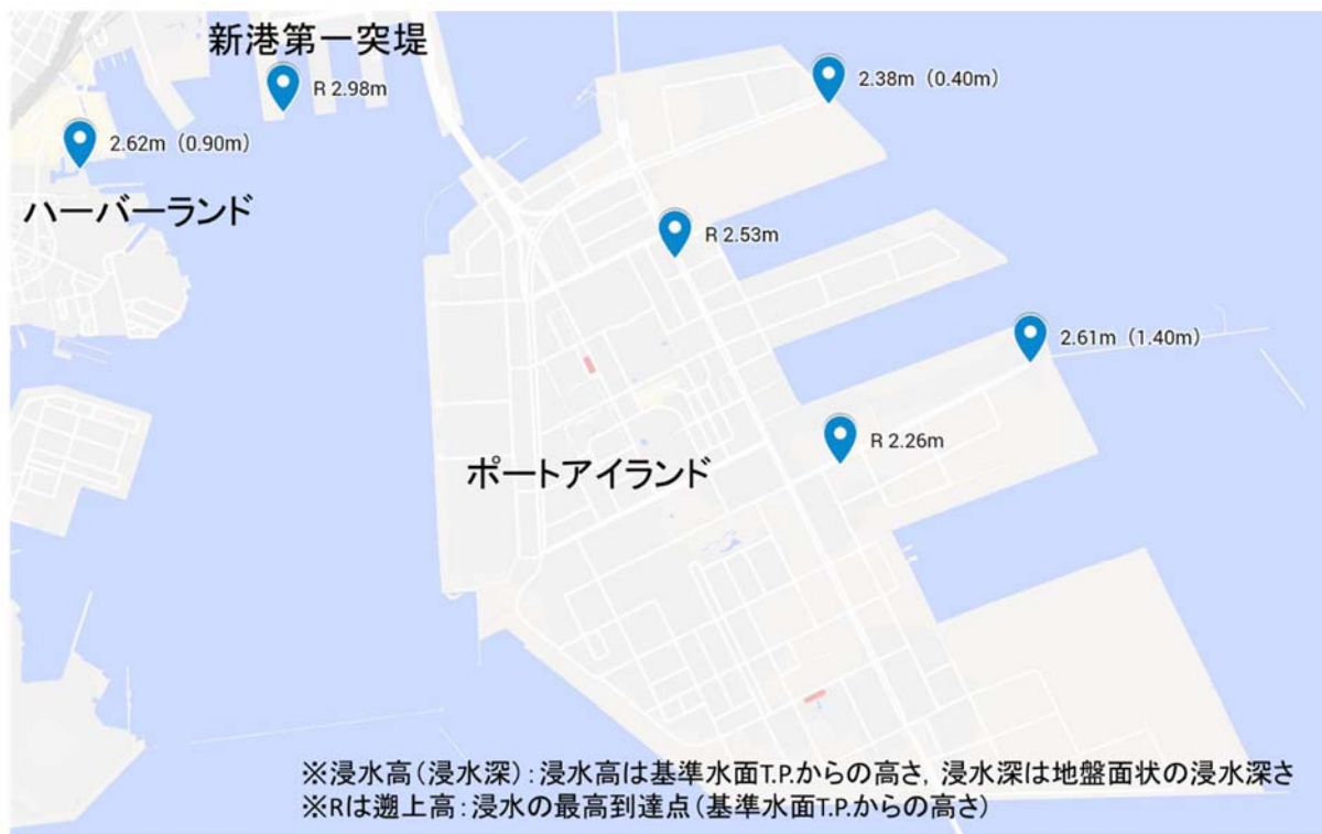
図3 ポートアイランドの浸水高(浸水深)