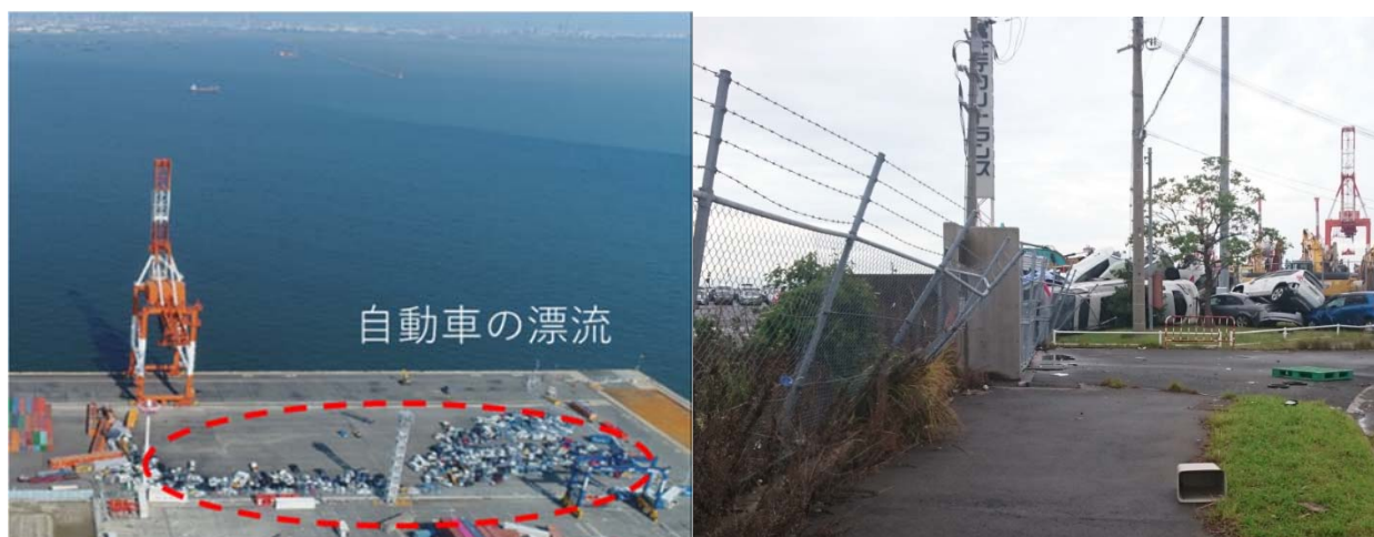
図5 自動車の漂流状況（六甲アイランド東側）