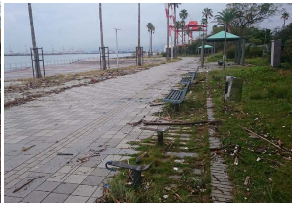
図6 自動車の漂流状況（六甲アイランド東側） 図7 六甲アイランド南側の浸水状況