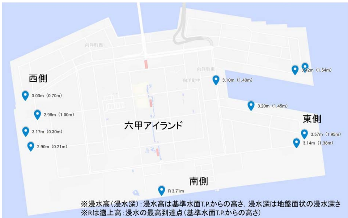
図2 六甲アイランドの浸水高 (浸水深)