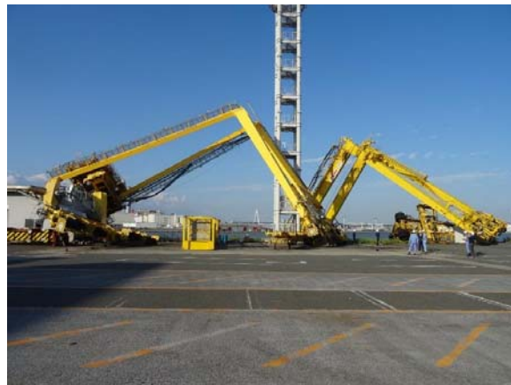
図8 強風によるコンテナを運ぶ車輛の逸走

夢洲コンテナターミナルは岸壁部で一部越波が発生した程度で、ヤードは浸水しなかった。高潮と波浪による被害は軽微だったが、強風により事前に固縛を行っていたものの、空コンテナが倒壊した。ただし、倒壊したのは、5段積みの空コンテナで、3段積みのコンテナでは倒壊の被害はなかった。また、強風によりコンテナを運ぶ車輛が逸走した（図8）。