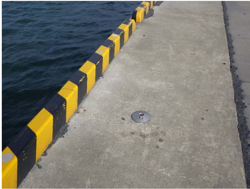
電位測定端子設置状況