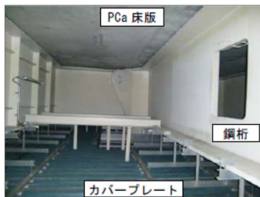
写真-参 2.2 上部工とチタンカバー プレートの間の空間

コンクリート構造物においては塩害を主たる劣化要因とし，コンクリート標準示方書に従ったコンクリート中の塩化物イオン濃度の照査を行って，100 年後の鋼材位置での塩化物イオン濃度が鋼材腐食発生限界濃度に達しないよう材料，配合，かぶりなどを決定した．そのため，腐食性環境下にあるコンクリート部材については，普通鋼材では必要かぶりが大きくなることから，エポキシ樹脂塗装を施した鋼材を使用した（写真-参 2.3）．また，PC 構造を積極的に採用し，活荷重載荷時の部材応力をひび割れ発生応力度以下に抑えてひび割れを生じさせないようにすることで高耐久化を図った．さらに，超高強度繊維補強コンクリート (UFC) を用いた床版（写真-参 2.4）を多用することで，高耐久化を図るとともに，上部工の軽量化を実現することで，下部工断面をスリムにしてコストダウンを図っている．