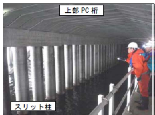
写真-参 2.4 点検歩廊