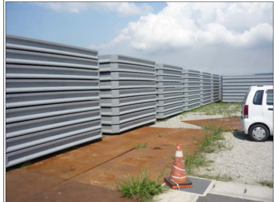
写真-参 2.4 超高強度繊維補強 コンクリート床版

D 滑走路の維持管理においては、点検診断を継続的に容易かつ確実に実施できることが基本であることから、施設へのアクセスが可能な点検通路を設けている。栈橋部や連絡誘導路橋梁では、チタンカバープレートが作業足場としての機能を有しており、上部工の PCa 床版や UFC 床版の目視点検が可能である（写真-参 2.5）。また、埋立/栈橋接続部の消波護岸の遊水室内部や PC 渡り桁の支承部分にも点検歩廊が設けられている（写真-参 2.6）。また、ジャケットの鋼桁上にある PCa 床版間の間詰め部は、水の浸入などにより劣化が進行しやすい懸念があるとともに、構造上も重要場部位である。しかし、直接目視ができないことから、棒状スキャナを挿入して鋼桁上の間詰めコンクリートのひび割れの発生状況を確認できる点検孔（直径 20mm）を設けている箇所もある。