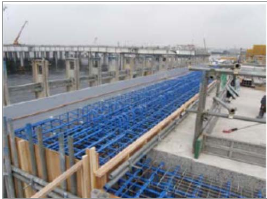
写真-参 2.3 エポキシ樹脂塗装鉄筋の 使用例