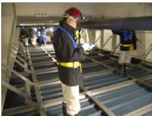
写真-参 2.5 チタンカバープレート上 での点検診断状況

D 滑走路の維持管理においては、点検診断を継続的に容易かつ確実に実施できることが基本であることから、施設へのアクセスが可能な点検通路を設けている。栈橋部や連絡誘導路橋梁では、チタンカバープレートが作業足場としての機能を有しており、上部工の PCa 床版や UFC 床版の目視点検が可能である（写真-参 2.5）。また、埋立/栈橋接続部の消波護岸の遊水室内部や PC 渡り桁の支承部分にも点検歩廊が設けられている（写真-参 2.6）。また、ジャケットの鋼桁上にある PCa 床版間の間詰め部は、水の浸入などにより劣化が進行しやすい懸念があるとともに、構造上も重要場部位である。しかし、直接目視ができないことから、棒状スキャナを挿入して鋼桁上の間詰めコンクリートのひび割れの発生状況を確認できる点検孔（直径 20mm）を設けている箇所もある。