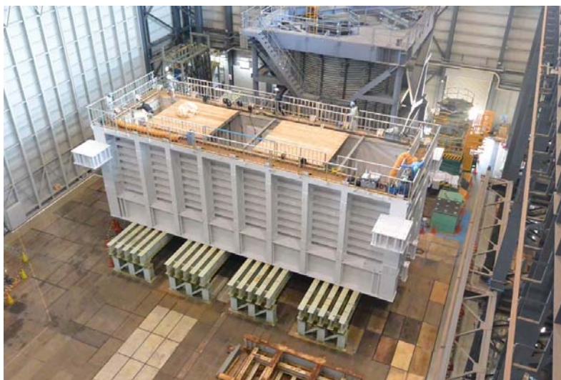
使用する直方体剛土槽