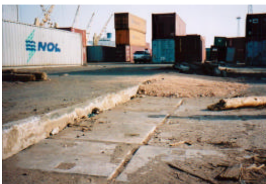
写真-6 液状化による棧橋-背後地盤間の段差