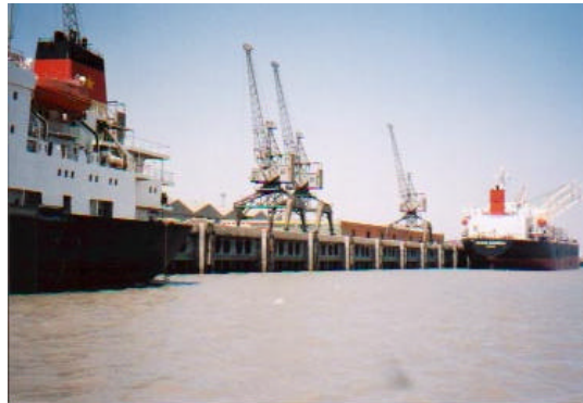
写真-1 パース No.1-5 の外観