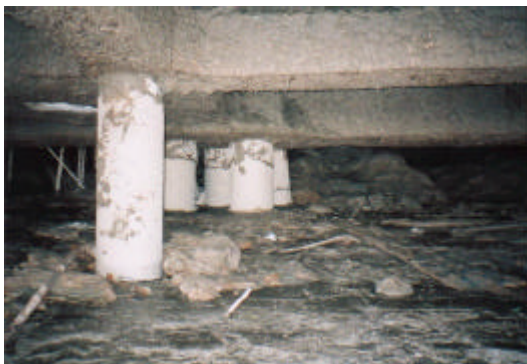
写真-4 陸側の RC 杭に生じたコンクリートの剥落