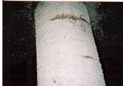
写真-3 RC 杭の被害状況 (直杭に生じたクラック)