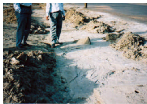
写真-7 液状化による噴砂