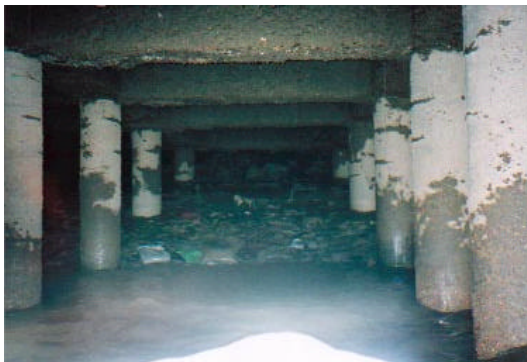
写真-2 RC 杭の被害状況 (直杭に生じたクラック)