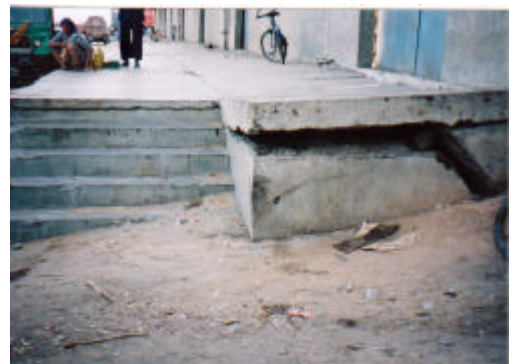
写真-5 液状化による上屋の被害